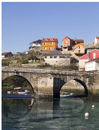
Ribarsko selo u Vigo