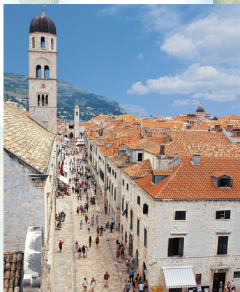
Stradun, dubrovačka glavna ulica