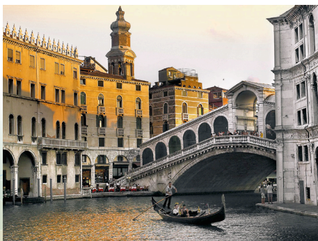
Most Rialto u Veneciji

Istočna obala Mediterana vjerojatno je najbolje čuvana tajna putnika. Među ovim obalama brojna carstva su izgrađena i srušena, rođeni su brojni mitovi te započela brojna putovanja. Neka vas ponesu brojne legende antičke Grčke i najvećih heroja Olimpijskih igara, prepustite se bogatoj povijesti i živahnim bazaarima Istanbula, u samom srcu Turske upijajte toplo izmirsko sunce, a prije povratka u romantične vodene kanale Venecije, prošetajte predivnim utvrđenim starim gradom - Dubrovnikom.