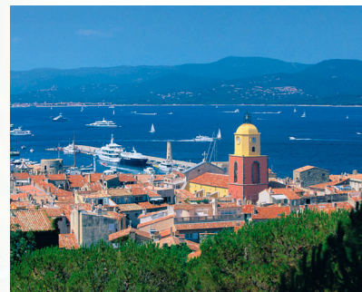
Panoramski pogled na St. Tropez

St. Tropez poznat je po svojim Sandales Tropéziennes koje se u ovom gradiću ručno rade od 1927. godine. Vodootporne i izrađene od prave francuske kože, par ovih sandala je obavezan dio garderobe imućnih mještana kao i brojnih slavni osoba koje ga posjećuju. Fino obrađene kako im ni slana morska voda ne bi mogla naštetiti, ove sandale neće nikada izaći iz mode.