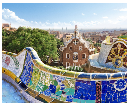
Glavna terasa parka Güell

Od uskih ulica Napulja, tradicionalnih tržnica Tunisa i La Ramble u Barceloni sve do Marseillea, glavnog grada Provanse, ovo putovanje otkrića nudi vam inspirativan obilazak najpopularnijih destinacija Mediterana na našem najnovijem brodu flote. Nikako ne propustite ove dragulje, kako na kopnu tako i na samom brodu.