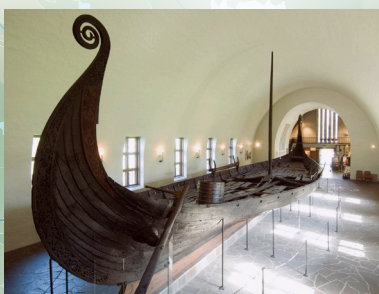
Muzej Kon-Tiki u Oslu