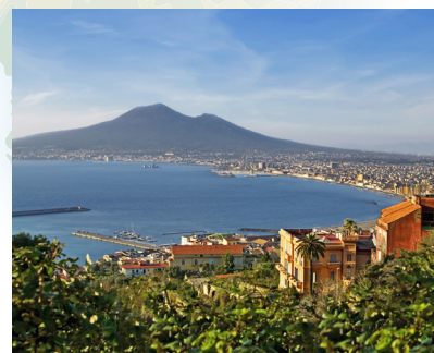
Panoramski pogled na Napuljski zaljev

Napulj se smatra mjestom rođenja pize, stoga ne propustite probati ukusnu pizzu Margheritu.