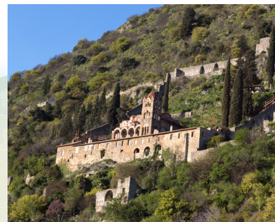
Samostan Pantanassa, Mystra

Na vrhuncu svoje moći (400 god. pr.Kr.) grčki grad Sparta imao je 500.000 robova i samo 25.000 stanovnika. Riječ „spartanski“ znači samokontrolu, jednostavnost, štedljivost i strogost.