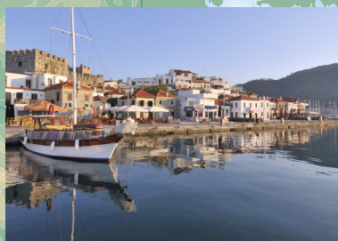
Pogled na Marmaris