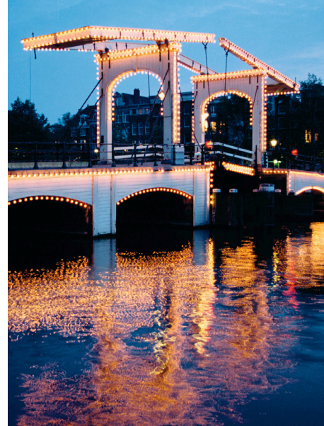
"Magere Brug", centar Amsterdama

Umorni ste od obilaska najpopularnijih europskih destinacija? U potrazi ste za nečim drugačijim od uobičajenih turističkih znamenitosti? Tada je ova sofisticirana i neobična odiseja Sjevernim Atlantikom baš za vas! Nakon obilaska londonskih atrakcija i otkrivanja njegovih skrivenih tajni te šetnje slikovitim amsterdamskim ulicama slijedi uživanje u izvrsnim plodovima mora u Vigo, najvećoj ribarskoj luci na svijetu, kao i istraživanje njegovih šarmantnih ulica prepunih ribarskih kuća. Saznajte o razvoju umjetnosti kroz povijest posjećujući poznate umjetničke galerije u Lisabonu, oduševit će vas neodoljiva arhitektura Guggenheim muzeja u Bilbau, a sigurno ćete uživati i u fascinantnom priobalnom gradu Le Havre koji se nalazi na UNESCO-vom popisu Svjetske baštine. Njegov muzej lijepe umjetnosti je među najboljima u Francuskoj.