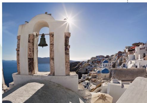
Pogled na selo Oia, Santorini