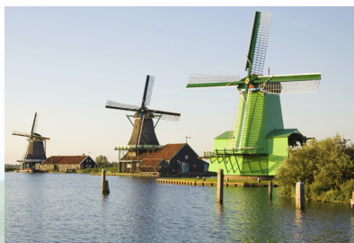
Vjetrorenjače u Zaanse Schansu, blizu Amsterdama