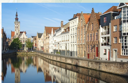
Srednjovjekovni grad Bruges