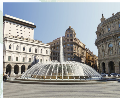
Piazza De Ferrari s fontanom

Genova je dom kauboja! Dobro, ne doslovno, ali upravo tu su nastale originalne traperice, mnogo prije nego što je taj proizvod predstavljen u SAD-u.