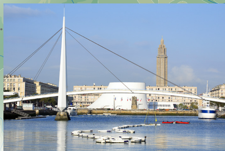
Pogled na Le Havre i most