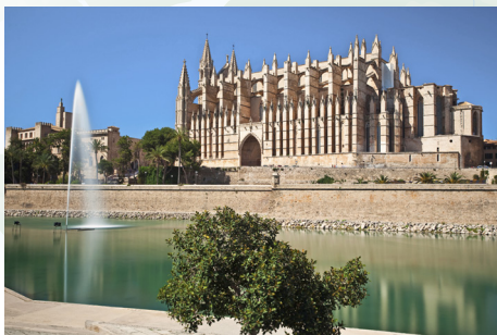
La Seu, katedrala u Palmi

Otkrijte tri najpoznatije plaže Mediterana na jednom uzbudljivom putovanju, upijajte tople sunčeve zrake na mjestima koja su ljeta na Mediteranu učinila svjetski poznatim. Ova tura vodi vas od modernog priobalnog grada St. Tropeza, smještenog na francuskoj Azurnoj obali, do kristalno čistog mora španjolskog otoka Menorce i živahnih zabava otoka iz skupine Baleara – Palma de Mallorce. Na samom kraju čeka vas netaknuta Smaragdna obala Sardinije i slikovita Amalfijska obala, popularna ne samo zbog očaravajućeg krajolika već i zbog fantastične kuhinje.