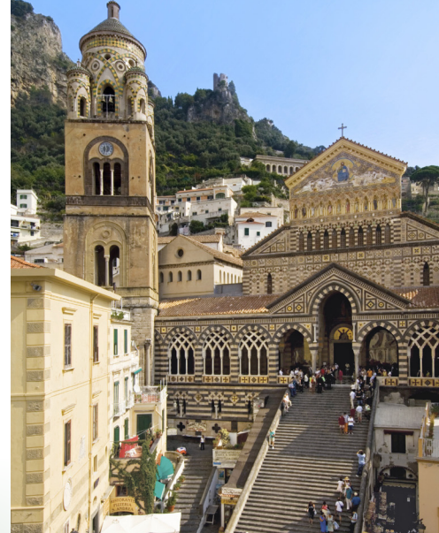
Katedrala sv. Andreja u Amalfiju