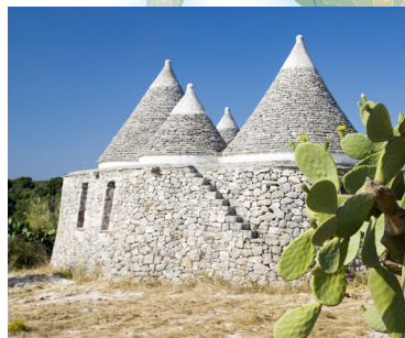
Trulli u Alberobellu