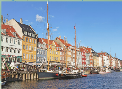
Raznobojne fasade duž Nyhavna

Od ostalih slavni vodopada fjordova izdajamo i Sedam sestara te Udvarača.