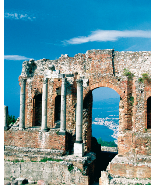
Ruševine "Teatra Greco" u Taormini

Tražite nešto potpuno drugačije od klasičnih atrakcija, želite li nešto novo, ekskluzivno, elegantno i „izvan utabanih puteva“? Tada je ovo krstarenje upravo za vas. Vodimo vas na zadivljujući obilazak skrivenih dragulja Mediterana, od sofisticirane i moderne Taormine do arheoloških nalazišta i zlatnih plaža Cipra, od čarobnog starog centra Rodosa koji se nalazi na popisu Svjetske baštine do taverni s nadstrešnicom od vinove loze u Zakynthosu, obavijenom mirisom jasmina. Vjetrovom nošeni od Rima stižemo do drevnog utvrđenog grada Jeruzalema koji će vas ostaviti bez daha.