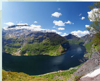
Pogled na Geiranger Fjord

Jedan od najznačajnijih vodopada na Geirangerfjordu je Mladenkin veo, nazvan tako zato što nježno pada preko stjenovitog ruba te, obasjan suncem, izgleda poput tankog vela koji sramežljivo prikriva stijene.