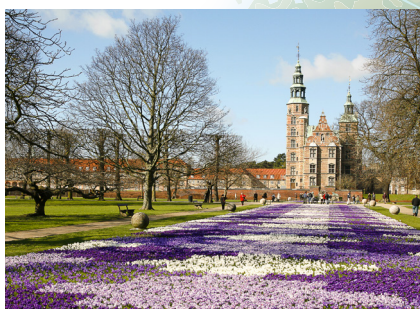
Pogled iz vrtova na Dvorac Rosenborg