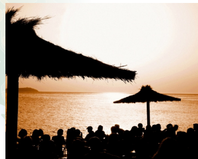
Zalazak sunca u tipičnom kafiću na plaži

Ibiza je prepuna zanimljivih mitova, legendi i folklor. Feničani su vjerovali da je Ibiza čaroban otok kojeg su Bogovi blagoslovlili jer crvena, bogata zemlja sprječava opstanak bilo koje životinje, insekta ili biljke koja bi mogla naštetiti ljudima.