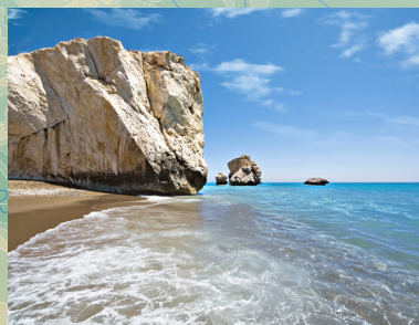
Aphrodite's Rock u Paphosu, Cipar