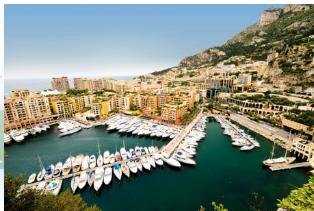
Panoramski pogled na Monte Carlo