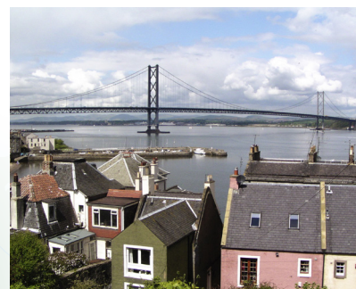
Pogled na most Forth Road

Most Forth Railway u South Queensferryju jedna je od škotskih ikona.