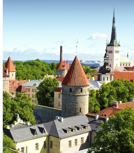
Pogled na stari grad, Tallinn

Preпустите се крос-културалном истраживању балтичких кралјевства, прошлости и садашњости, гдје очаравујућа умјетност, растућа дизајнерска сцена, иновативна архитектура и нордијска кухиња сусрећу кралјевске палаће, повјесна блага и фасцинантне музеје. Освојит ће вас сликовити стари град Таллина, модерни барови Копенхагена, величанственост Ст. Петербурга и елеганција Стокхолма.