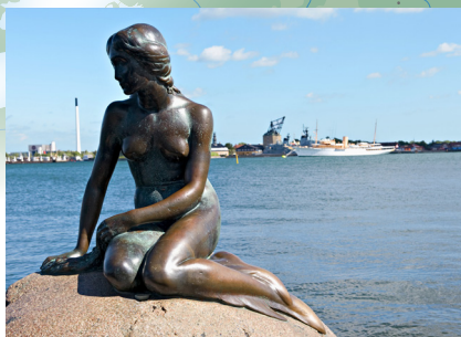
Kip Male sirene u Langelinieu

Osjetite taj isti vikinški duh dok ploвите fjordovima!