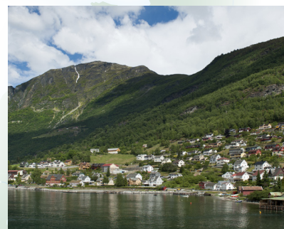
Aurlandsfjords u Aurlandu, blizu Flaama

U srednjem vijeku, Norvežani su bili jedni od najboljih graditelja brodova u Europi. Počeli su istraživati svijet već u 9. stoljeću, ploveći do Grenlanda i Kaspijskog mora.