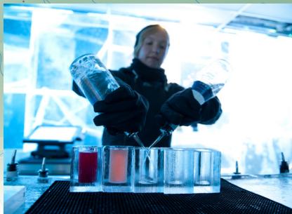
Ice Bar u Kopenhagenu