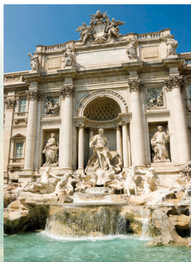
Fontana Trevi u Rimu