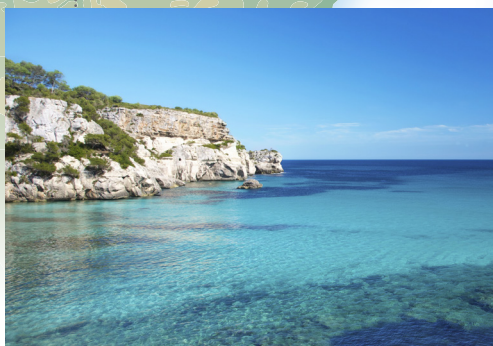
Tipična plaža otoka Menorca

St. Tropez poznat je po svojim Sandales Tropéziennes koje se u ovom gradiću ručno rade od 1927. godine. Vodootporne i izrađene od prave francuske kože, par ovih sandala je obavezan dio garderobe imućnih mještana kao i brojnih slavni osoba koje ga posjećuju. Fino obrađene kako im ni slana morska voda ne bi mogla naštetiti, ove sandale neće nikada izaći iz mode.