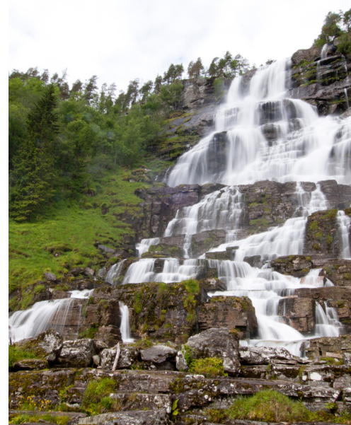
Vodopad Tvindefossen, blizu Flaama

Krenite na putovanje u zemlju u kojoj je vrijeme stalo; netaknuta, nenaseljena i uglavnom nepristupačna, s iznimkom brodova. U ovoj zemlji zapanjujućih kontrasta, smaragdno zeleni bljeskovi polarne svjetlosti ostavit će vas bez daha, pogotovo ako znate da se za „sezonu“ promatranja Aurore Borealis 2013. godine predviđa da će biti najspektakularnija u 50 godina. Svako putovanje do nevjerojatnih fjordova Hellesylta, Geirangera i Flaama je novo buđenje. Dan završite istraživanjem, planinarenjem, plovidbom kajakom kroz predivan norveški krajolik, otkrivajući ljepotu sirove i predivne prirode. Polako se vraćamo u moderan život posjetom skandinavskim prijestolnicama dizajna, umjetnosti i arhitekture, Kopenhagenu i Oslu, s njihovim izvanrednim muzejima umjetnosti kao i odličnim ribljim restoranima.