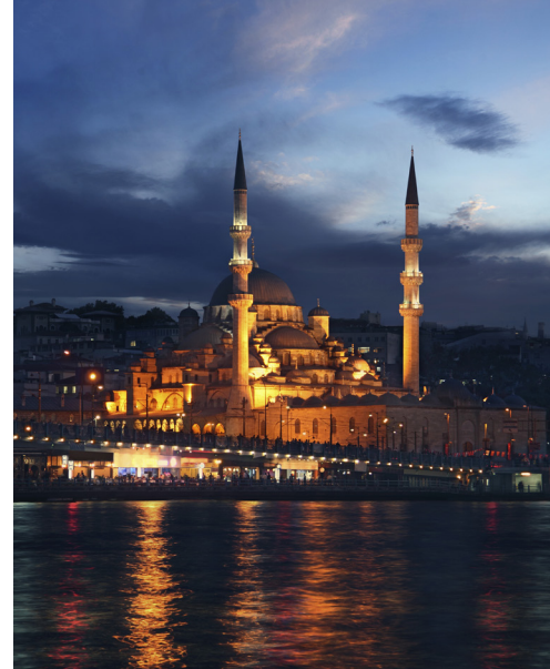
Džamija Sultana Ahmeda (Plava džamija), Istanbul