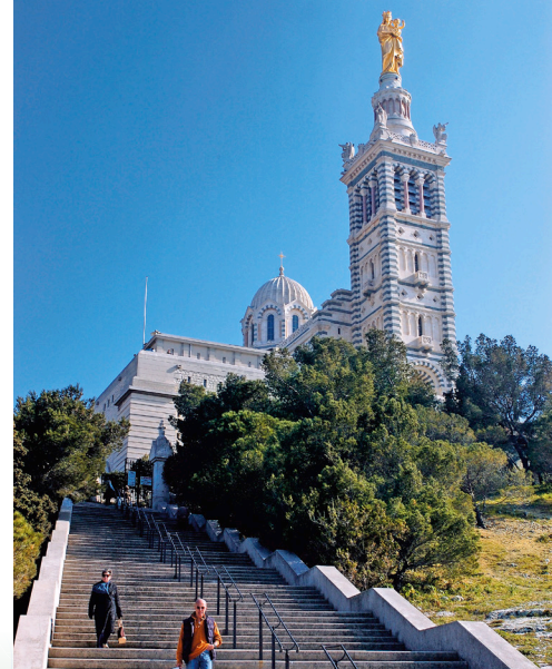
Bazilika Notre-Dame-de-la-Garde, Marseille