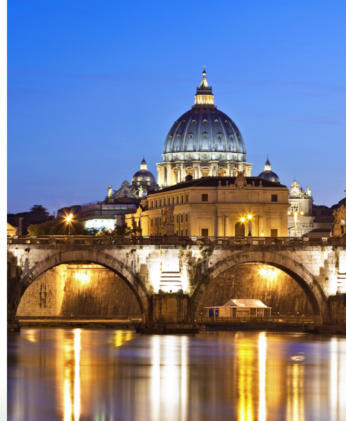
Pogled na Baziliku sv. Petra, Rim

Prošetajte ulicama slavnog Rima, otkrijte tunišku medinu, saznajte o porijeklu flamenca prilikom posjete Valenciji te uživajte u legendarnoj kozmopolitskoj atmosferi Barcelone na ovom putovanju kroz istinske prijestolnice umjetnosti i kulture Mediterana.