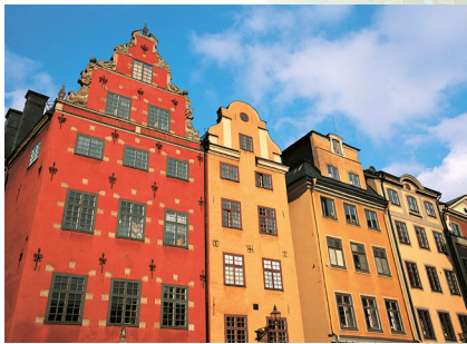
Raznobojne kuće u Gamla Stanu, starom gradu Stockholma