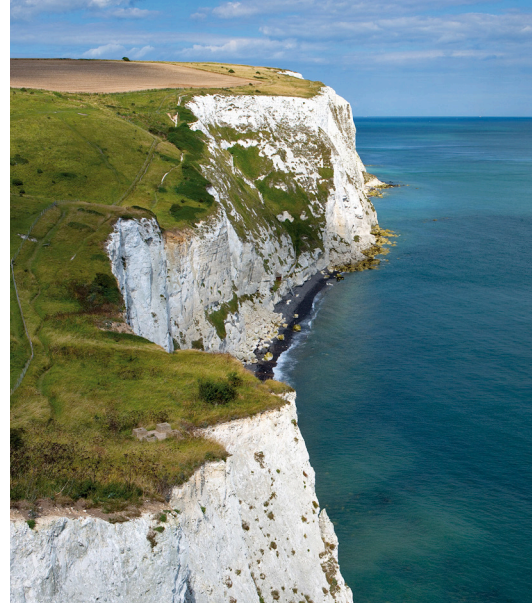
Bijele klisure u Doveru

Od crvenih klisura otoka Helgoland do bijelih u Doveru, ovaj itinerer otvara tajna vrata do skrivenih dragulja Sjevernog Atlantika gdje su se nebo, more i kopno spojili u prizore koji oduzimaju dah. Očarat će vas kamene ulice i zapanjujuće bogato arhitektonsko naslijeđe Edinburgha, upoznajte Newcastle i njegovo poznato pristanište, otkrijte ona ista svjetla koja su oduševila slikare impresionizma u Le Havreu, a zatim, iz Zeebruggea, prošetite savršeno očuvanim srednjovjekovnim gradom Brugesom prije nego se prepustite jedinstvenoj atmosferi amsterdamskih kanala. Svakako preporučamo svim putnicima koji su u potrazi za nečim drugačijim.