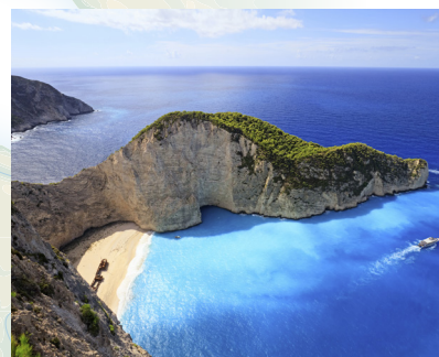
Popularna plaža Navagio

Grčki otoci poput Zakynthosa imaju reputaciju pomalo opuštenog poimanja vremena (osim, naravno, kada se brinu o svojim posjetiteljima).