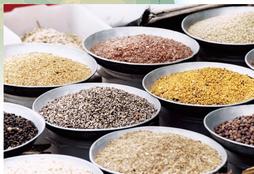
Začini tipične tunižanske tržnice

Stvorena u čast kraljice Margarine Savojske, njezine tri boje: zeleni bosiljak, bijela mozzarella i crvene rajčice, podsjećaju na talijansku zastavu.