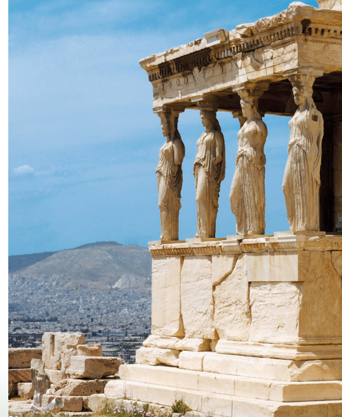
Karijatide Erechtheiona, Atena

Istraživanje Katakolona, Atene, Krfa i Santorinija dat će putnicima savršenu sliku o Grčkoj: nevjerojatoj zemlji prepunoj povijesti, predivnih plaža i šarmantnih sela. Na ovom putovanju otkrićete i neka skrivena blaga poput zidinama opasanog Dubrovnika ili Barija smještenog na samom početku pete talijanske čizme koji nudi dramatičnu kombinaciju bajkovitih ljetnikovaca, baroknih crkava i poganskih plesova.