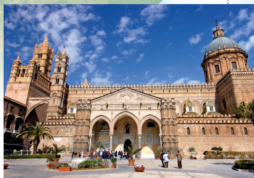
Katedrala u Palermu

Čak i danas otočani često nose privjeske koji sadrže svetu zemlju vjerujući da ih štiti od zla.