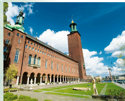
Gradska vijećnica u Stockholmu

Stockholm ima najdužu umjetničku galeriju na svijetu?