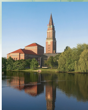
Operna kuća i gradska vijećnica u Kielu