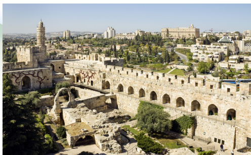
Stari grad Jeruzalem