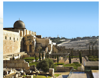
Pogled na Stari grad Jeruzalem

Jeruzalem ima vrlo poseban zoološki vrt. Službeni mu je naziv Tisch Family Zoological Gardens, no diljem svijeta je poznat kao Biblijski Zoo.