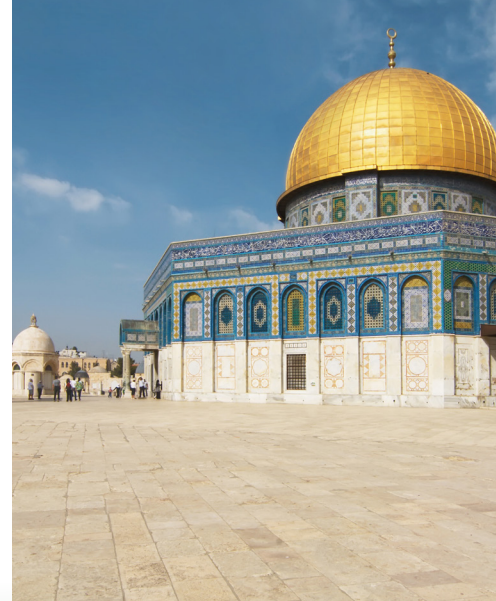
Kupola na stijeni u Jeruzalemu

Od tisuću crkava i bazilika Rima, predivnih džamija Marmarisa i jeruzalemske jedinstvene mješavine religije i kulture, ovo putovanje je savršen spoj kulturalnog otkrivanja i sunčanih plaža, intrigantnih uvida u povijest i religiju te opuštajuće plovidbe toplim i kristalno čistim morima jugoistočnog Mediterana.