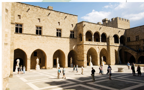
Palača velikog magistra Rodskih vitezova