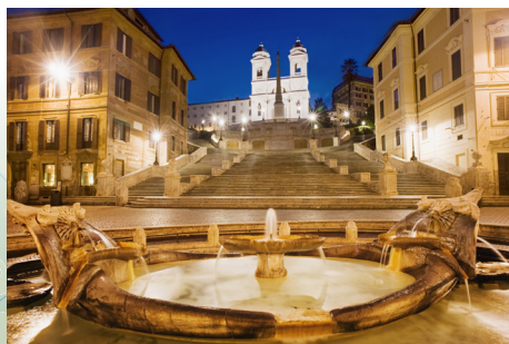
Španjolske stube i Fontana della Barcaccia gledajući s Piazzes di Spagna