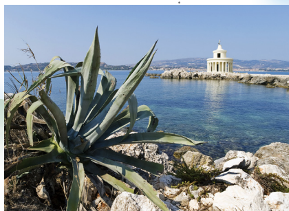
Svjetionik Agion Theodoron

Riječ „lakonski“, što znači sažet i jezgrovit, također potječe od Spartanaca koji su bili poznati i cijenjeni po sažetosti govora.