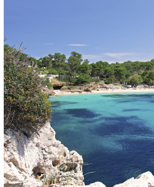
Obala otoka Mallorca

Od poznatih španjolskih otoka ludih zabava Ibizе i Palma de Mallorce, fantastične Azurne obale na francuskoj rivijeri do zapanjujućeg glavnog grada Italije, Rima, te pričaма bogatih palača i dvoraca Palermo, ovo krstarenje nudi savršenu formulu svim ljubiteljima sunca koji žele najbolje od noćnog života Balearskih otoka, ne propuštajući zanimljive kulturne znamenitosti.