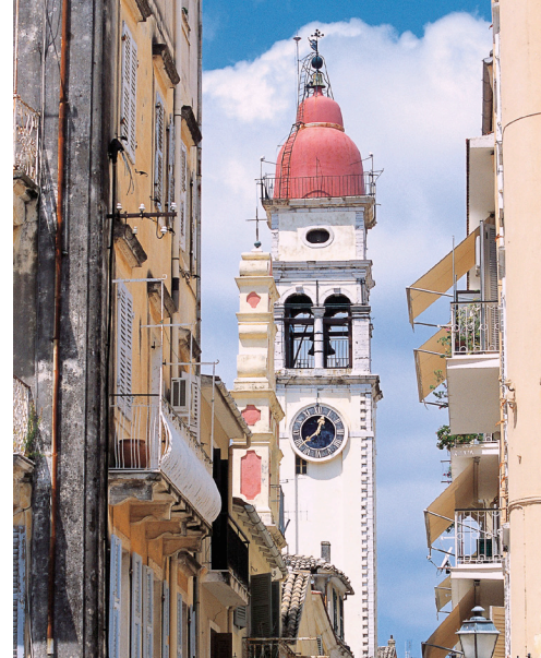
Zvonik crkve St. Spyridon u Krfu

Uronite u stranice ovog uzbudljivog itinerera i otkrijte romantiku skrivenih mjesta te grčke otoke bogate povijesti i dramatične prirodne ljepote. Prva stanica je Conero rivijera, jedna od najljepših obala sjevernog dijela Jadrana. Zatim plovimo do Kotora, Crna Gora, s predivnim, mirnim, čistim morem i pošumljenim planinama koje se uzdižu sa svih strana dajući mu izgled fjorda. Samu srž Grčke upoznat ćete pristajanjima u Krk, Gythion i Kefaloniju, s čistim toplim morem, brojnim stablima maslina, uskim popločenim ulicama i sjajnim bijelo-plavim kućama. Prepustite se srcu i duši istočnog Mediterana na ovoj inspirativnoj turi prepunoj povijesti i romantičnih zalazaka sunca.