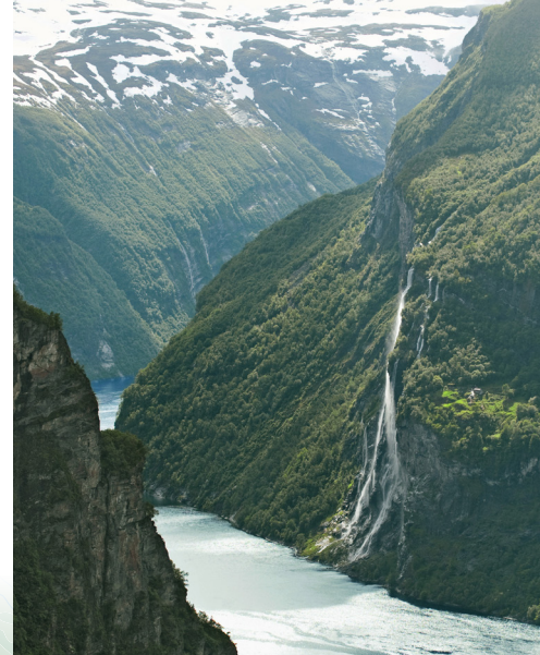
Pogled na Geiranger Fjord

Duboko zaronite u samo srce dramatičnih krajolika na ovom epskom susretu s prirodom. Planinarite, zaplovite brodom ili kajakom predivnom Norveškom s obilaskom spektakularnih gradova na fjordovima Geirangera, Flaama i Stavangera. Uživajte u pogledu na planine s vrhovima prekrivenim snijegom, netaknutu prirodu i posebnu magiju polarne svjetlosti. Putovanje otkrića začinjeno je modernim životom s pristajanjima u skandinavske prijestolnice Kopenhagen i Oslo koje ovom putovanju u divljinu sjevera daju dozu kulture.